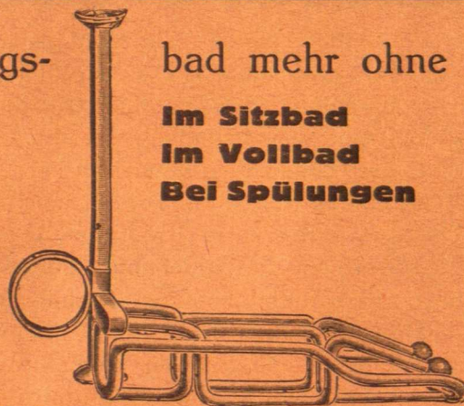
Geschlossen zur Einführung

Resflose Umspülung der gesamten Scheide und des Scheideneinganges